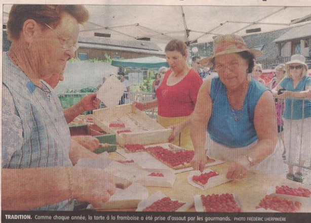
TRADITION. Comme chaque année, la tarte à la framboise a été prise d'assaut par les gourmands.