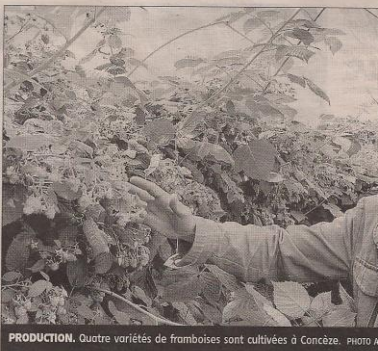
PRODUCTION. Quatre variétés de framboises sont cultivées à Concèze.

Toute la journée, ventes de petits fruits rouges bio, mais aussi de produits en transformation artisanale (liqueurs, sirops, gelées, vinaigres...). Les ateliers culinaires (de 10 heures à 17 heures), animés par le chef du restaurant du musée du Président Jacques Chirac, combleront les