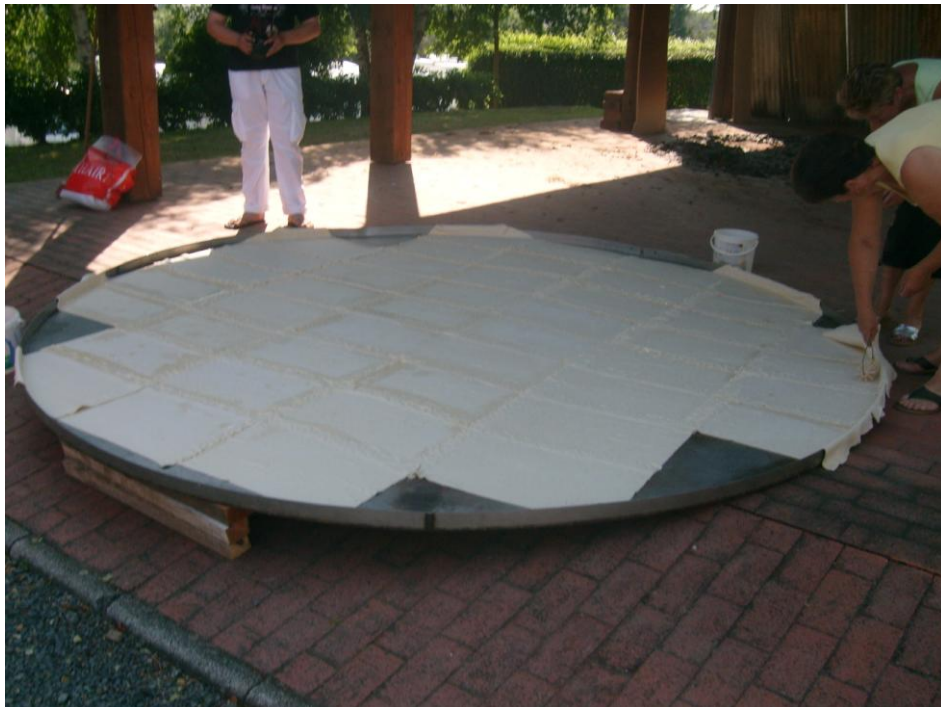
La tôle contenant la pâte est posée sur les briques réfractaires