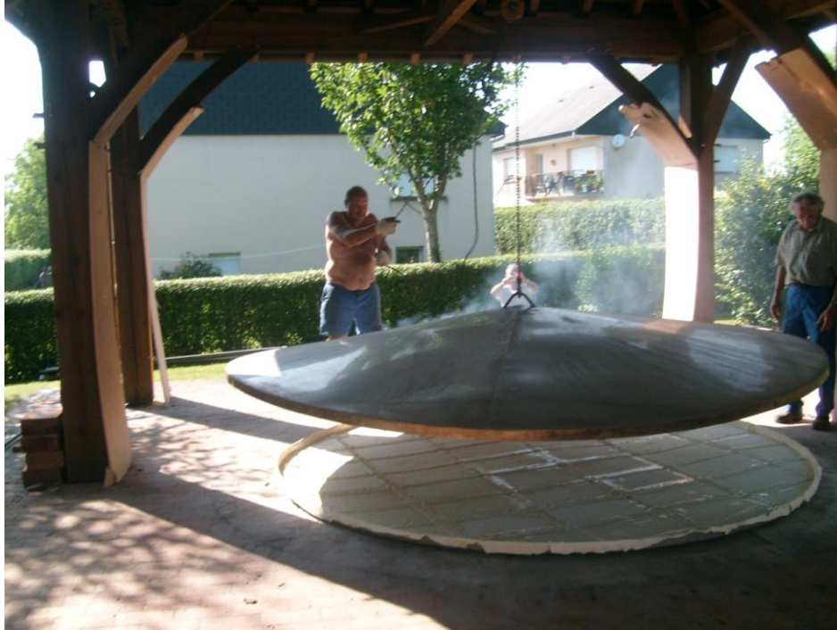
Le couvercle est posé sur l'ensemble La tarte cuit toute la nuit jusqu'à l'aube