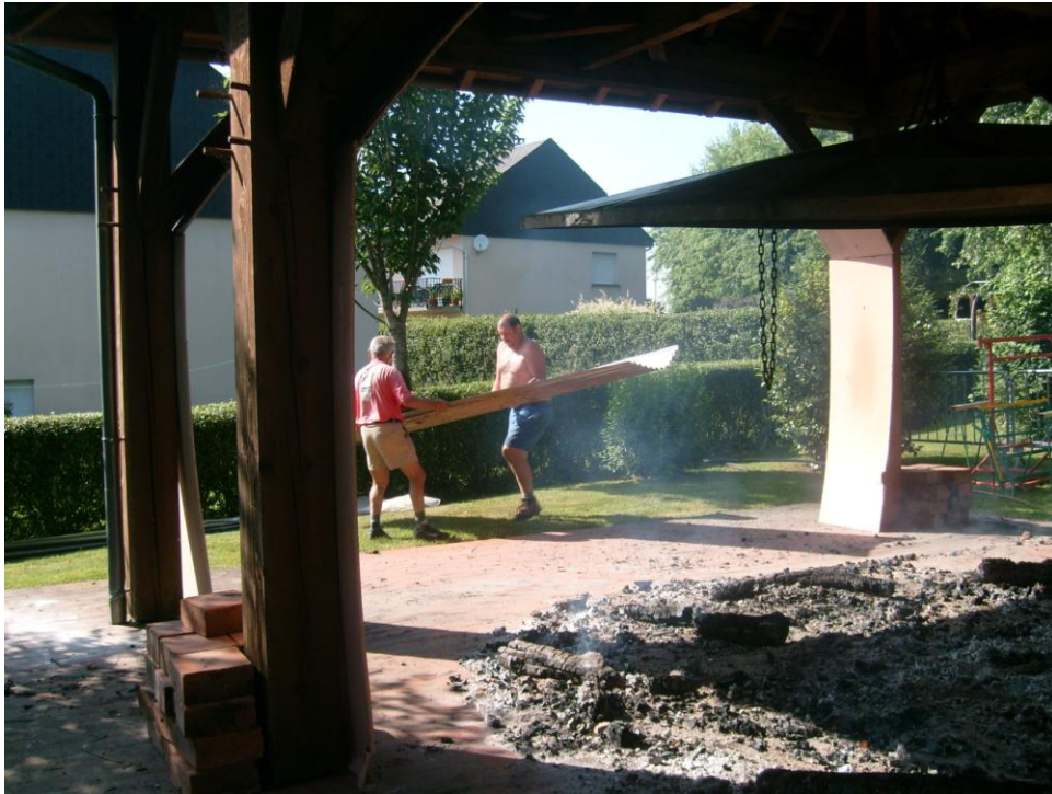
La veille vers 17h, les braises sont retirées